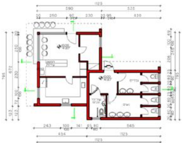
תבנית קניית 100 מ"ר